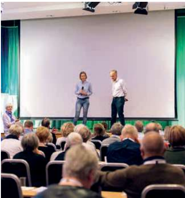
📷 Lymfekreftforeningens landsmøte 2018