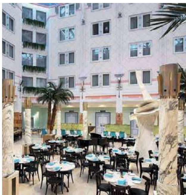
Thon Hotel Oslofjord